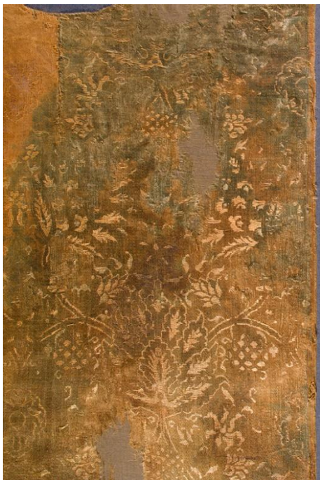
Tkanina s palmetami, rostlinným motivem a květy s drobnými kosočtverci; 1. polovina 14. století; střední Asie; surcot s tříčtvrtečním rukávem z pohřební výbavy jedné z manželek Karla IV.