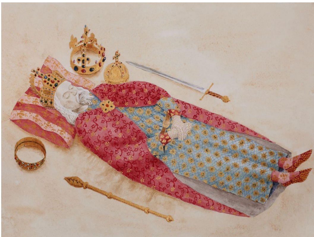
Karel IV. na katafalku – rekonstrukce podoby pohřební výbavy a oděvu Karla IV. (kresba: P. Chotěbor)