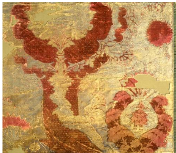
Vlasová tkanina s rozetami, granátovými jablky a květy; okolo poloviny 15. století; Itálie; polštář z pohřební výbavy Ladislava Pohrobka († 1457)