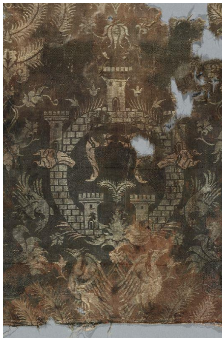
Tkanina s hradbami a zvířaty; pokročilá druhá polovina 14. století; Itálie; oděv z pohřební výbavy jedné z manželek Karla IV.